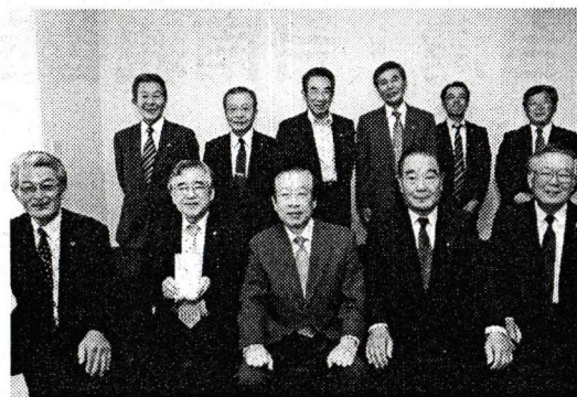
台北市光華獅子會捐款賑災合影

を行うなどの交流を続けている。台北駐福岡経済文化辦事處處長曾念祖もその会員の一人。九州・山口地区では84のライオンズクラブ、43のロータリークラブが台湾側のクラブと姉妹関係を締結しており、緊密な友好関係にあると言える。